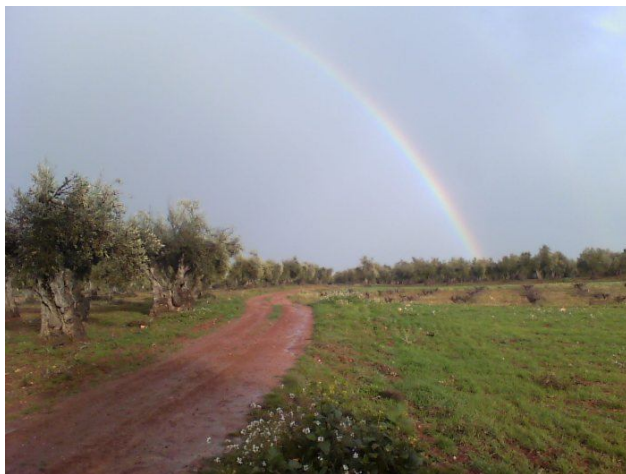
Pista de ciclabilidad buena