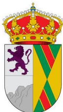
Ayuntamiento de Orusco