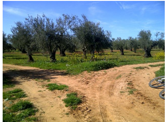
Cruce de pistas de ciclabilidad buena. Campo de olivos sin arar y sin podar