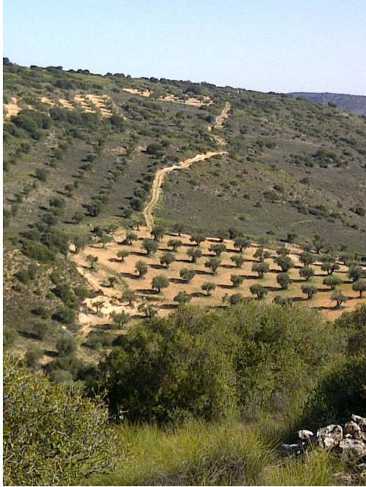
Pista de ciclabilidad regular que acaba en plantación de olivar y continúa

Hay campos de olivo que están abandonadas, (sin arar y sin podar) y en el mapa están dibujados como árboles dispersos.