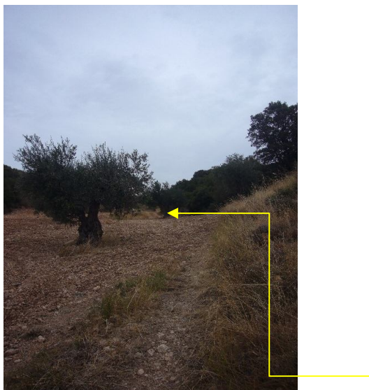
Pista de ciclabilidad regular que acaba en olivo y continúa