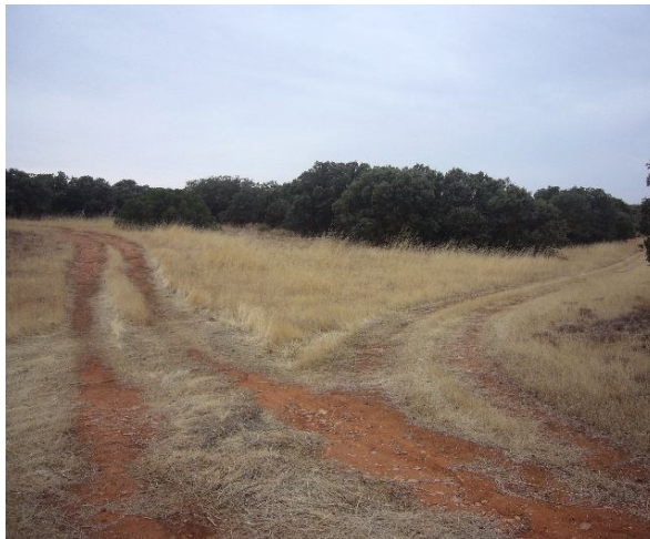
Cruce de pistas de ciclabilidad regular.