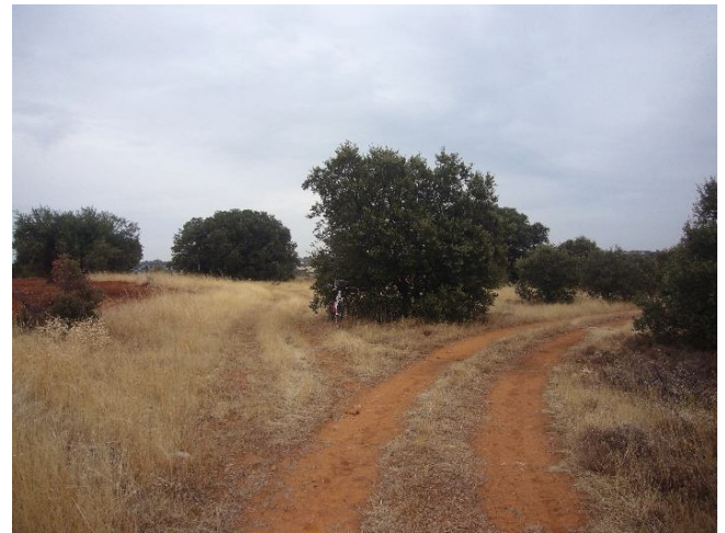
Cruce de pista de ciclabilidad buena con ciclabilidad regular (izquierda)