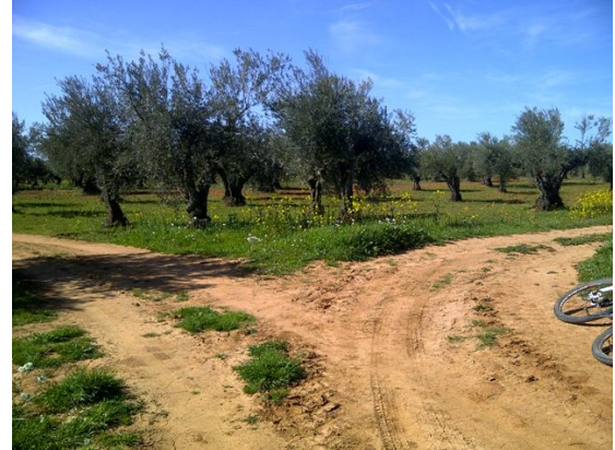
Cruce de pistas de ciclabilidad buena. Campo de olivos sin arar y sin podar